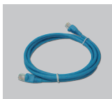
Ethernet (CAT-5e) Cable