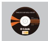
CD-ROM (D-Link Click'n Connect. Manual and Warranty)