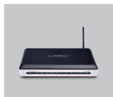
DVA-G3672B Wireless G VoIP ADSL2+ Router

If any of the items are missing, please contact your reseller.