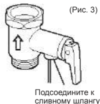
Подсоедините к сливному шлангу